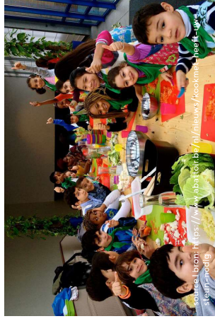
KookMet, abattoirs d'Anderlecht, Bruxelles KookMet, slachthuis Anderlecht, Brussel