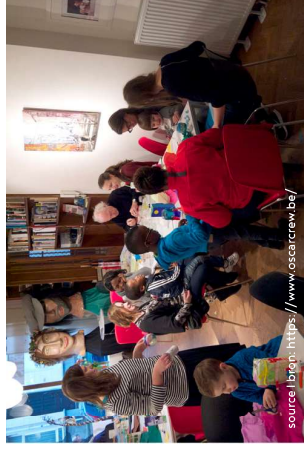
Oscarcrew, atelier de bricolage Oscarcrew, Knutselatelier