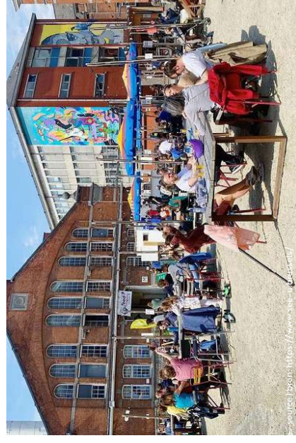
See U, fête de quartier, Ixelles See U, buurtfeest, Elsene