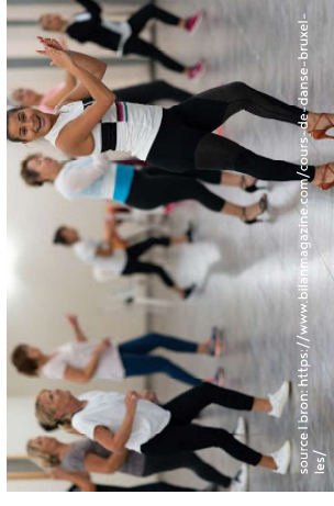
Cours de danse, Bruxelles Dances, Brussel