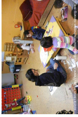
Nekkersdal, IBO Garderie extra-scolaire Nekkersdal, IBO, buitenschoolse opvang